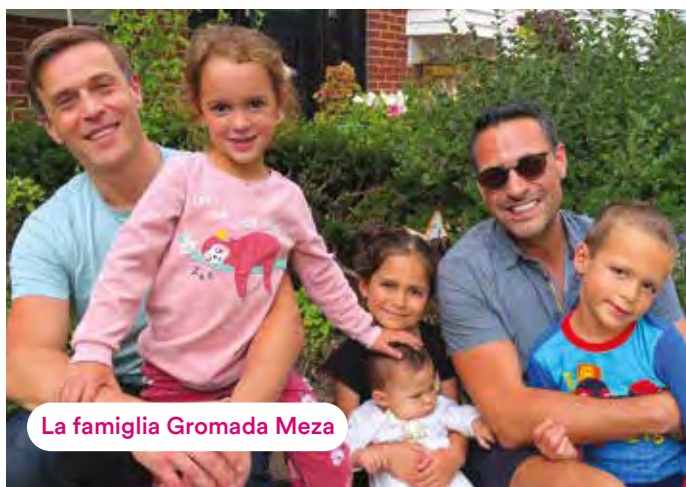
La famiglia Gromada Meza