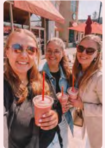
Eva Repubblica Ceca Pausa frullato