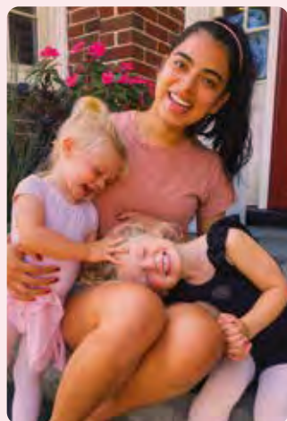
Abi Messico Lezione di ballo