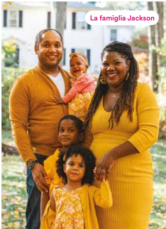
La famiglia Jackson

Vive in una città universitaria di provincia