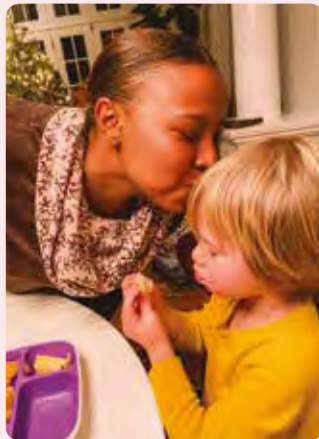
Tshiamo Sudafrica Colazione per due