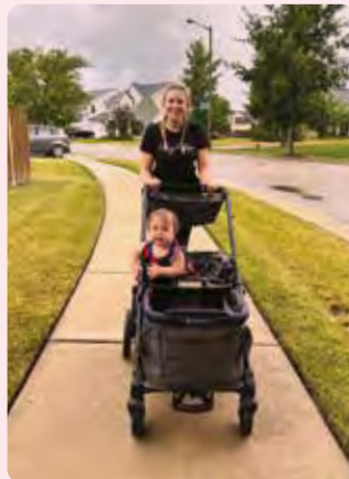
Hanna Austria Passeggiata mattutina