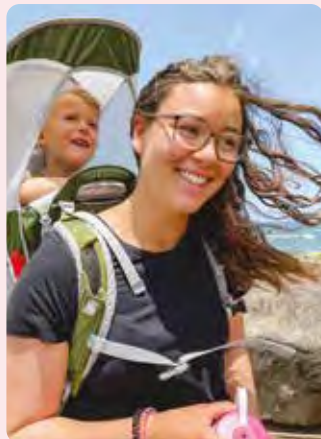
Miri Germania Escursione